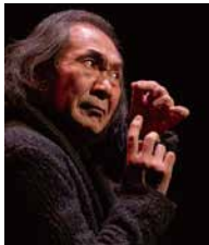
井上弘久 Inoue Hirohisa / 俳優・演出家

1952年、東京生まれ。1979年より劇団転形劇場(太田省吾・主宰)に所属。名作「水の駅」「小町風伝」などで、日本および海外各地の舞台を踏む。1990年より劇団U・フィールドを主宰。構成・演出をつとめる。同劇団解散後、2013年より文学作品を一人で舞台化する「朗読演劇」を開始。チャールズ・ブコウスキーの「町でいちばんの美女」カフカの「変身」で好評を得る。2018年より石牟礼道子「椿の海の記」全十一章の連続上演を開始。三年をかけて全十一章の上演を果たして後、現在その全国行脚公演を遂行中。